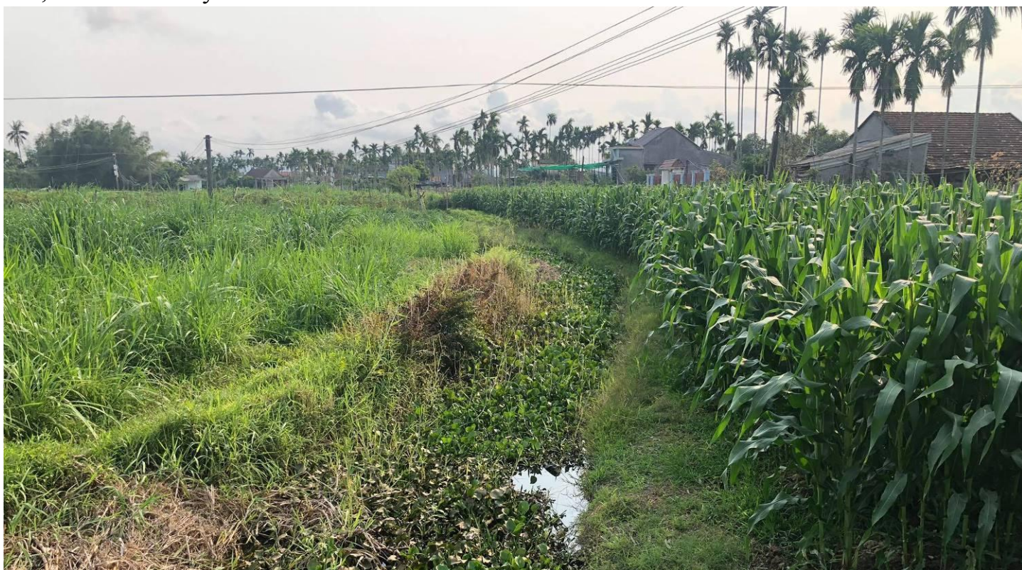
Hình 2. Kinh Vĩnh Lợi đoạn nằm khu vực ranh giới xã Nghĩa Hiệp – Nghĩa Thương