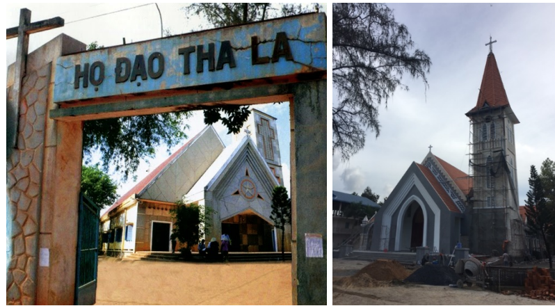
Nhà thờ Tha La trước (1999) và đang đại tu (2016).