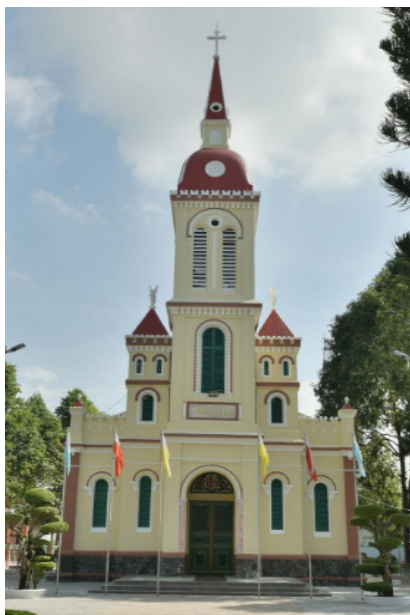
Nhà thờ Tây Ninh. Ảnh: Võ Thành Tâm 2017

Tây Ninh Philipphê Trần Tấn Bình đến thăm và trao tặng vào năm 2005, hiện đang đặt giữa cung thánh nhà thờ Ngã Sáu 6 .