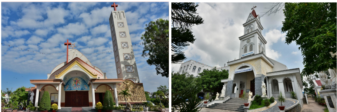
Nhà thờ Phong Cốc và Gò Dầu. Ảnh Võ Thành Tâm 2016