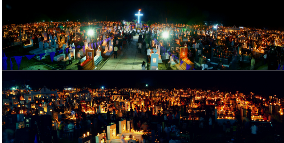
Đêm Canh thức cầu cho các tín hữu qua đời 01 rạng 02-11 tại Đất Thánh (Nghĩa trang) Họ đạo Tha La.