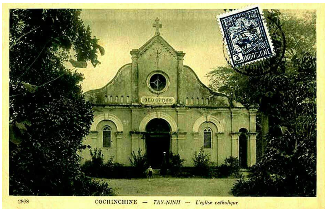
Nhà thờ Tây Ninh. Ảnh tư liệu lưu giữ tại nhà thờ.