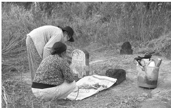
Cúng chạp mả ngày 25 tết.

Chạp mả hay còn quen gọi là đi dầy cỏ mả bắt đầu từ đầu tháng chạp, nhưng chủ yếu mọi người đi vào 25 tết và dần thành thói quen, thành lệ. Con cháu quét dọn sạch sẽ mộ phần ông bà, người thân quá vãng để chuẩn bị đón tết, còn được hiểu là mời ông bà về ăn tết với gia đình. Những ngôi mộ không có người chăm sóc cũng được người dân ở xung quanh đó quét dọn, thắp hương, việc này phần nào an ủi người quá vãng và cũng thể hiện được tình làng nghĩa xóm một đức tính cao quý của người Việt.