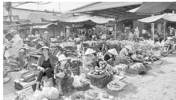
Chợ tết ở Suối Sâu (An Tịnh, Trảng Bàng).

29 tết đông vui nhất là ở chợ, tiểu thương tranh thủ bán hết hàng để về nhà chuẩn bị tết, tấp nập người đi sắm đồ trang trí nhà cửa hay mua bông, trái cây, rau củ, đồ ăn về chưng dọn, nấu nướng chuẩn bị mai cúng rước ông bà;... Bàn thờ ngày tết trong các gia đình ở Tây Ninh rất quan trọng, bông thường chọn mai, vạn thọ, huệ, cúc,... trái cây chưng ngũ quả, chuộng nhất vẫn là măng cầu, dừa, đu đủ, xoài, sung hay trái thơm, cặp dưa hấu tròn... hiểu tâm lý của người mua nên chợ tết không bao giờ thiếu những món này.