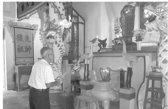
Cúng đưa thân ở đình An Tịnh (Trảng Bàng).

25 tết, ở đình làng thì cúng sấp ấn đưa thân, cô bóng cúng sấp ấn đưa tiên, một số chùa thì tảo tháp, sấp bút đưa chú thiên, ở các gia đình có thờ ông bà độ mạng (gia thần) thì cúng đưa ông bà. Vì khi xưa, lễ thờ trong các gia đình chủ yếu viết bằng mực Tàu trên giấy hồng đơn, nhà khá giả hơn thì thờ bằng tranh kiếng, trải qua một năm thờ tự, giấy hồng đơn bị phai màu, sau khi cúng đưa ông bà họ gỡ liền xuống hóa bỏ và đến nhờ các vị sư ở chùa hoặc những người giỏi chữ Nho viết giúp liền mới để đem về thờ, dịp này họ cũng nhờ viết bức hoành, cặp đối với những nội dung chúc tết, mừng xuân về trang trí nhà cửa.