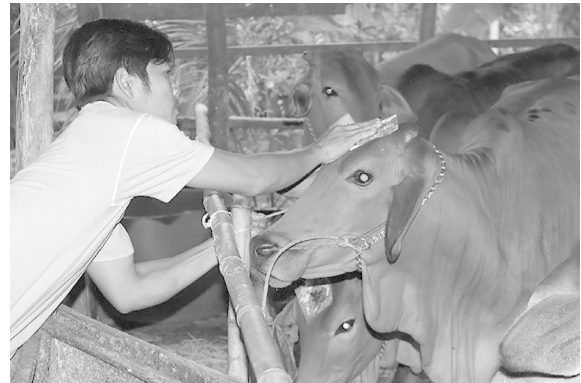
Tết bò ở Gia Lộc, Trảng Bàng.

Vào ngày này, hầu như nhà nào cũng có cúng tết nhà, ở mâm cúng đất đai viên trạch có đòn bánh tét (thường loại không nhân), giấy tết nhà. Giấy tết nhà xưa cắt hình thoi hay hồ lô bằng giấy hồng đơn hoặc vàng bạc đại, về sau này có giấy in sẵn chữ “phước”, “đại cát”, “chiêu tài tiến bửu”,... sau khi cúng người chủ nhà đem dán lên nhà và các vật dụng trong gia đình. Ngoài ra, còn có tết vườn dán lên cây, tết giếng, tết chuồng,... những nhà có nuôi bò hay trâu thì có thêm tết bò, tết trâu, mỗi con đều được dán giấy và ăn một cái bánh (thường là bánh cốm), sau khi cúng tết bò (trâu), ông cắt cỏ bò (trâu) tới lạy con bò (trâu) và được nhận tiền cúng của chủ nhà cũng được xem là tiền thưởng trong năm.