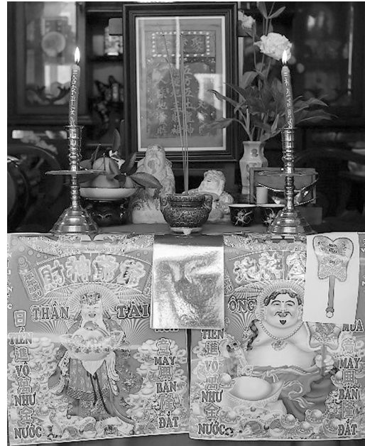
Cúng vía đất mùng 10 tết.

Theo quan niệm ngũ hành tương sinh “thổ sinh kim” tức đất sinh ra vàng bạc, tiền tài nên về sau ông Địa và ông Thần Tài được xem là một đôi thờ chung cùng một tran. Những năm gần đây mọi người xem ngày mùng 10 tháng giêng còn là ngày vía Thần Tài,