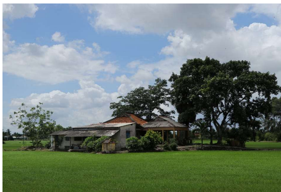
Miếu Đền cổ kính ở xã Tân Phước Tây, huyện Tân Trụ

Ngôi miếu Đền cổ kính và có quan hệ mật thiết với đình Tân Phước Tây (huyện Tân Trụ) là một cơ sở tín ngưỡng quý hiếm ở Nam Bộ.