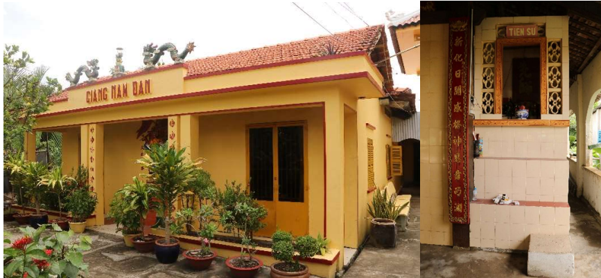
Giang Nam Đàn và miếu Tiên Sư ở đình Tân Ân

“Tiên Sư”, vốn của nhà việc Cần Đức (vị trí của Ủy ban Nhân dân thị trấn Cần Đức nay).