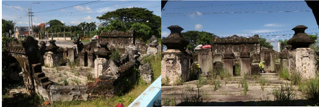
Mộ ông chủ Chợ Trần Quang Tập (ảnh Nguyễn Thanh Lợi)

Khu mộ họ Võ (thường gọi là mã Ông Huyện), gần đó cũng có mộ vợ chồng cai tổng là những khu mộ có giá trị lịch sử và kiến trúc.