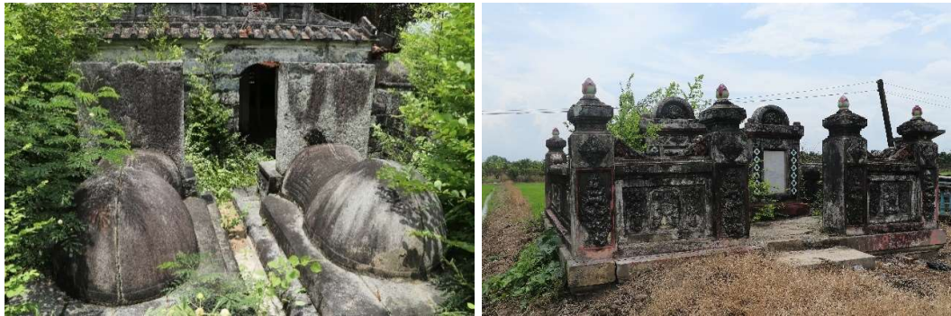
Khu mộ họ Võ và mộ ông bà cai tổng ở huyện Tân Trụ

Khu mộ họ Võ (thường gọi là mã Ông Huyện), gần đó cũng có mộ vợ chồng cai tổng là những khu mộ có giá trị lịch sử và kiến trúc.