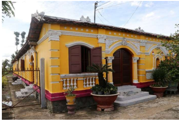
Phước Lâm cổ tự - di tích nghệ thuật quốc gia (xóm Chùa, xã Tân Lâm, huyện Cần Đước) xây dựng vào năm 1880