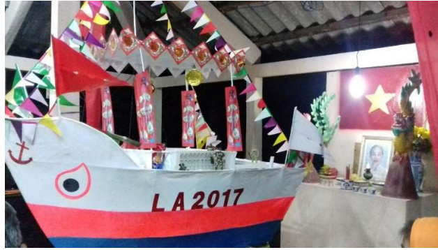
Tàu Tống phong trong lễ Kỳ yên miếu Thần Hoàng ở xã Tân Trạch (Cần Đước)