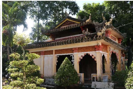
Đình Tân Phước Tây và ngôi thờ Tiên Sư ở huyện Châu Thành

Long An hiện còn nhiều nhà vương (miếu Tiên Sư) ở phường 6 (tp. Tân An, di tích lịch sử - văn hóa cấp tỉnh) 7 , xã Long Sơn, xã Tân Lâm (huyện Cần Đước); xóm Câu (xã Phước Lại, huyện Cần Giuộc); huyện Đức Hòa: Sò Đo, Gò Cao (thị trấn Hậu Nghĩa), An Hưng (xã An Ninh Đông); Giồng Voi, Rừng Muối (xã Tân Mỹ), Hòa Hiệp 2 (xã Hiệp Hòa), Gò Sao (xã Tân Phú), Mỹ Hạnh (xã Mỹ Hạnh Bắc)... Những người dân quê