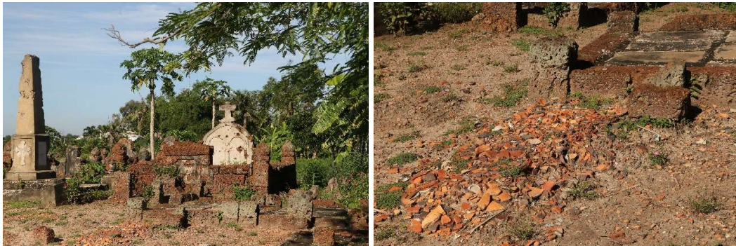
Mộ cổ và gạch Óc Eo ở nghĩa trang Nha Ràm