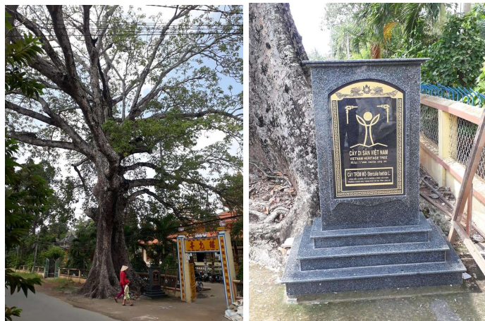
Cây di sản ở Khánh Hậu, tp. Tân An

Cây Trôm mỗ có tuổi đời 250 năm, là cây di sản của làng Khánh Hậu (tp. Tân An). Chùa Linh Sơn (chùa Núi, xã Đông Thạnh, huyện Cần Giuộc), trong khu di tích khảo cổ học Rạch Núi hiện có nhiều cây di sản được công nhận.