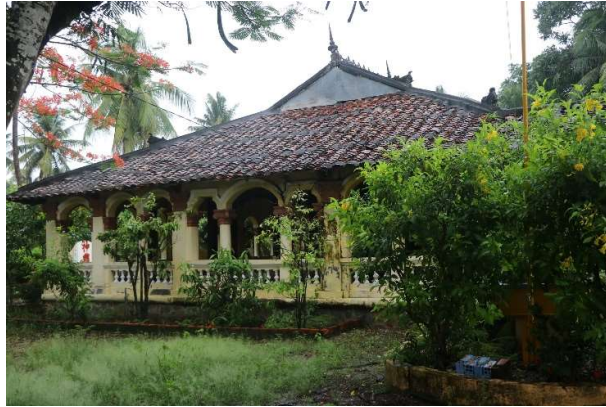
Đình Gia Thạnh ở huyện Châu Thành

Đình Gia Thạnh ở huyện Châu Thành là một trong những ngôi đình có kiến trúc đẹp ở Nam Bộ.