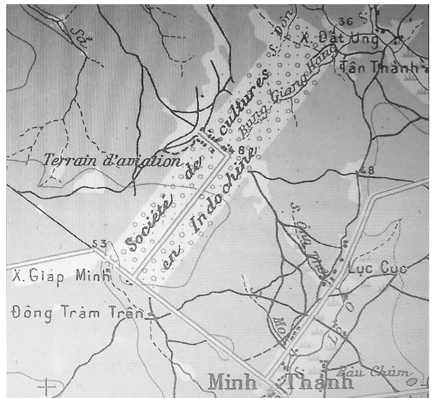
Đồn điền Minh Thạnh - Lược đồ 1952. Nguồn: TTLTQG II - Phòng Phủ Tổng thống Đế nhất Cộng hòa

Thạnh trở thành một trong 6 thôn của tổng Tân Minh, quận Hớn Quản, tỉnh Thủ Dầu Một vào năm 1955, để rồi từ sau Sắc lệnh 143-NV ngày 22/10/1956 sáp nhập vào quận An Lộc, thuộc tỉnh Bình Long vừa được lập ra cùng với 21 tỉnh thành khác trên bộ phận lãnh thổ Nam Phần Việt Nam 2 .