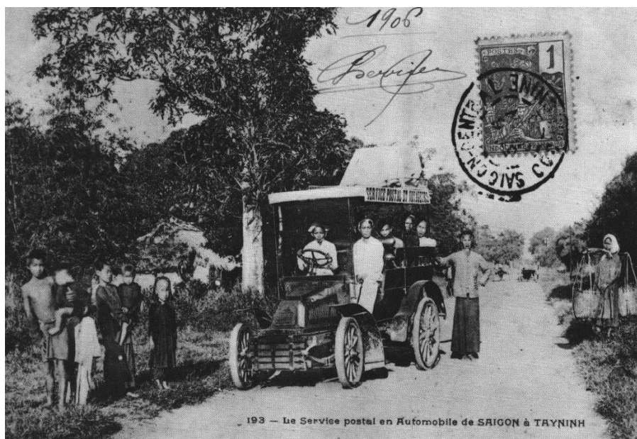
Con đường thiên lý cũ

chống lại quân xâm lược Xiêm ” 18 . Khi con đường này mới được mở theo ghi nhận của bộ sử nhà Nguyễn thì “ đường xa vắng vẻ, không có nhà cửa dân cư ” 19 . Tuy nhiên việc mở con đường này đã có tác động rất lớn đến công cuộc khai khẩn vùng đất Tây Ninh. Lưu dân người Việt từ Hóc Môn, Củ Chi tìm lên, từ vùng Mỹ Tho, Ba Giồng ngược sông Vàm Cỏ kéo đến khai khẩn, định cư thành những thôn ấp dọc 2 bên con đường mới mở.