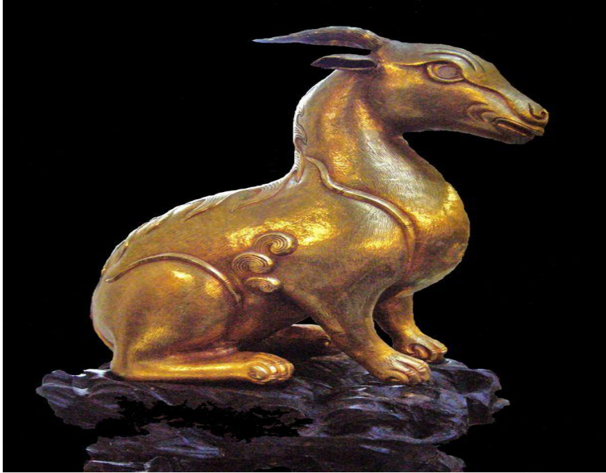
Giải trãi thời Nguyễn

Trong khi thực thi công việc, các ngôn quan nhiều lần phải đụng chạm tới những người có chức quyền cao hơn mình, nhưng vẫn không kiêng dè. Một minh chứng điển hình là tháng 12 năm Giáp Dần (1434), ngôn quan Phan Thiên Tước dâng sớ hạch tội Tiền quân tổng quản Lê Thụ vì đang có quốc tang (tang vua Lê Thái Tổ) mà lấy vợ, làm nhà cao cửa rộng, cho người nhà mua bán vụng trộm với người nước ngoài. Sau khi phân xử, dù có Đô đốc Lê Ván, Tư mã Lê Ngân cố giải cứu, nhưng Lê Thụ vẫn bị tịch thu 15 lạng vàng, 100 lạng bạc mua bán vụng trộm, còn người vợ lẽ được cưới thì phải rút khỏi hộ tịch nhà Lê Thụ để làm người dưng (22) . Chính từ lời hạch tội của hai vị Thị ngự sử là Đinh Cảnh An và Nguyễn Vĩnh Tích tháng 6 năm Đinh Tỵ (1437) về sự chuyên quyền, lấn át cả vua Lê Thái Tông của Đại tư đồ Lê Sát mà ngay lập tức Lê Sát bị xét xử và khép vào tội chết cho thấy tiếng nói của ngôn quan có trọng lượng lớn đối với triều đình. Thậm chí Đô ngự sử Nguyễn Quang Bật sau phải chết vì lòng trung khi không thay đổi di chiếu dù mẹ nuôi Lê Tuấn (sau này là Lê Uy Mục) đút lót để mong Lê Tuấn được làm vua.