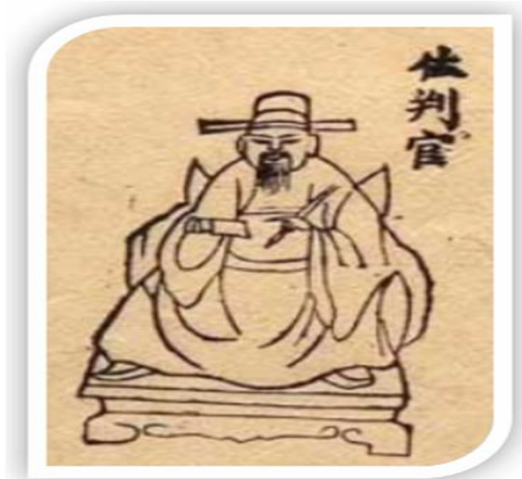
Tranh Quan xét xử án